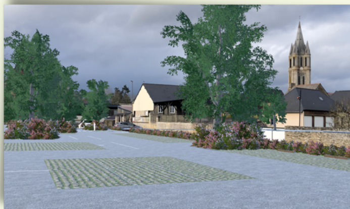
aménagement boulevard Dr. Ernest Gautier

La 2ème tranche concernera les rues annexes, soit la rue Haute Rive, rue de l'Apothicaire, rue du four Davier et rue des Ecoles d'un côté, ainsi que la place de l'église et la rue des Cordiers de l'autre côté de la D2. Les études de cette 2ème tranche démarreront ce printemps 2021.