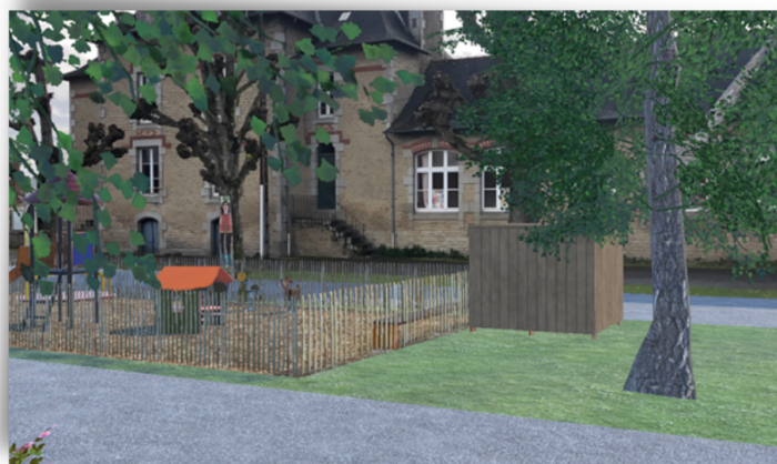
aménagement aire de jeux